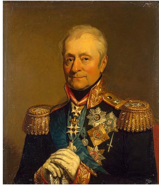
C in C Ruso.- General Bennigsen 15" Malo

Como veis el bueno de Bennigsen es un mal general, mientras que Eugene es bueno, Diego tirara 3 dados para ver sus puntos de mando mientras que yo solo tirare uno... sin embargo el bueno de Bennigsen dio lo máximo en la batalla que le toco luchar.